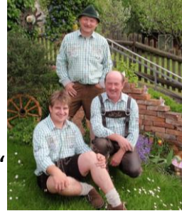
De Rittsteiger Lumpen

Ab ca. 21 Uhr musikalische Unterhaltung mit der Musikgruppe „Näähville“